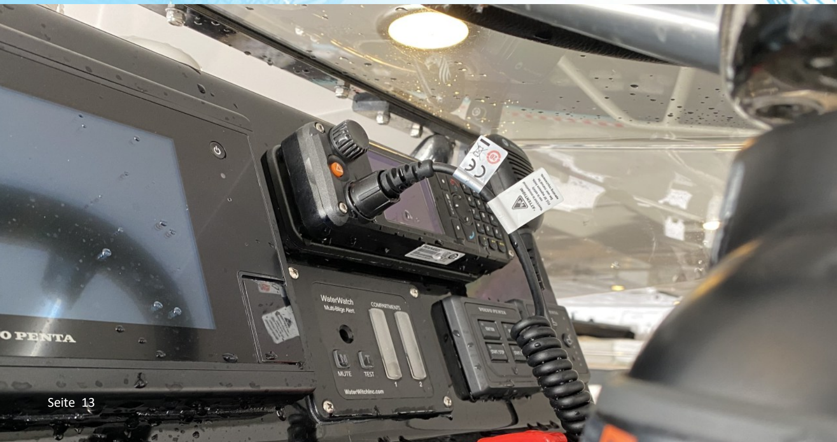
MXM600 - M6