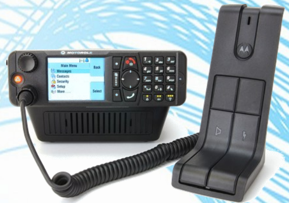
MXM600, Ausführung als Tischgerät

Die Modell Motorola MXM600 ermöglicht die Anbindung von 2 Bedienköpfen jeweils mit einem Tischmikrofon, zum Beispiel für eine Doppelbedienung von 2 Arbeitsplätzen.